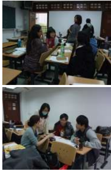
圖為上台演練之前的案例討論

班級經營是教師的教育專業知能的完整展現，此課程理論和實務兼具，並且以多元方式呈現，包括演練、案例討論，以及班規制定模擬。