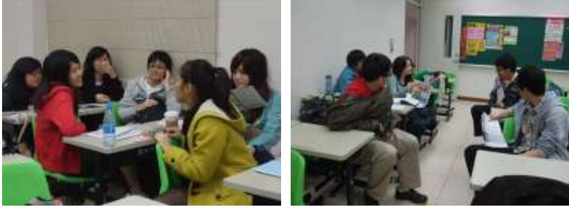
圖為分組議題討論

此課程以問題導向，喚醒同學對生活周遭和社會議題的關注，並且採取改善行動。藉由規劃執行的歷程，培養學生的公民素養，本學期(100上)學生討論的行動議題包括：校園訊息傳布管道效能改善，以及校園腳踏車停車環境改善。