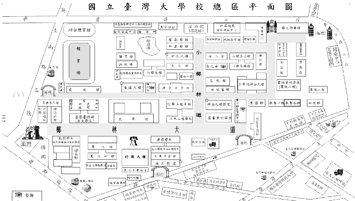
NIU MAIN CAMPUS MAP 國立臺灣大學 校總區地圖