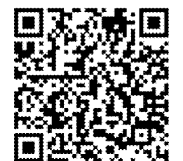
線上報名 QR code