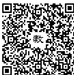
111 年活動教學模組指引連結

https://drive.google.com/file/d/1Jj54br7kdKy5Ojln1YeOr7C9tJvPfvSG/view?usp=sharing