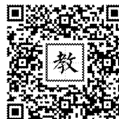
112 年活動教學模組指引連結